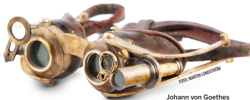
Johann von Goethes spökglasögon.