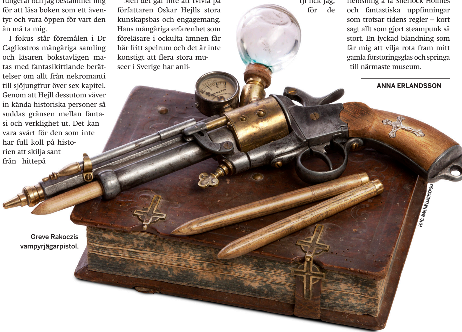
Greve Rakoczis vampyrjägarpistol.