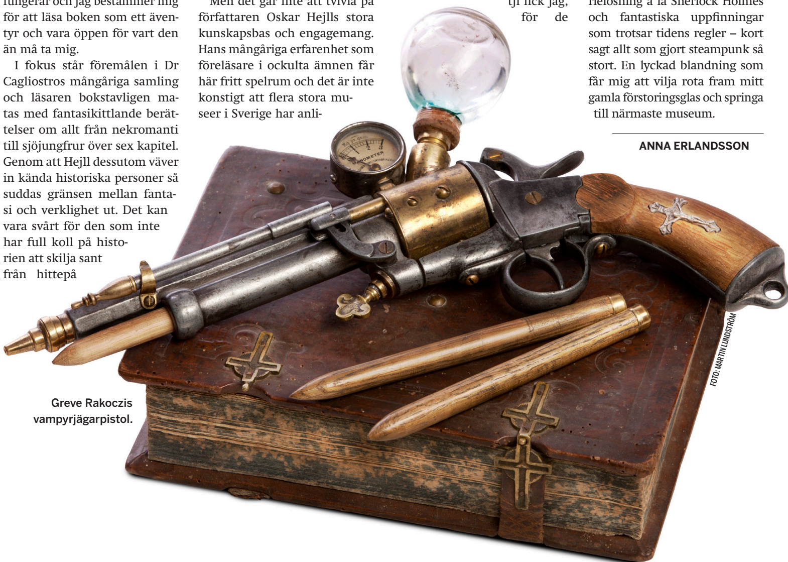
Greve Rakoczis vampyrjägarpistol.