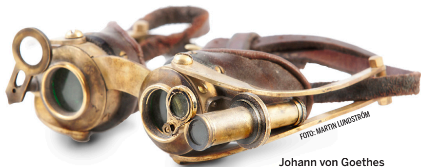
Johann von Goethes spökglasögon.